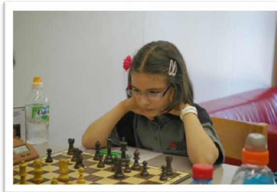
Erste Runde, volle Konzentration