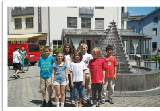
Gruppenfoto aller U10 Finalisten